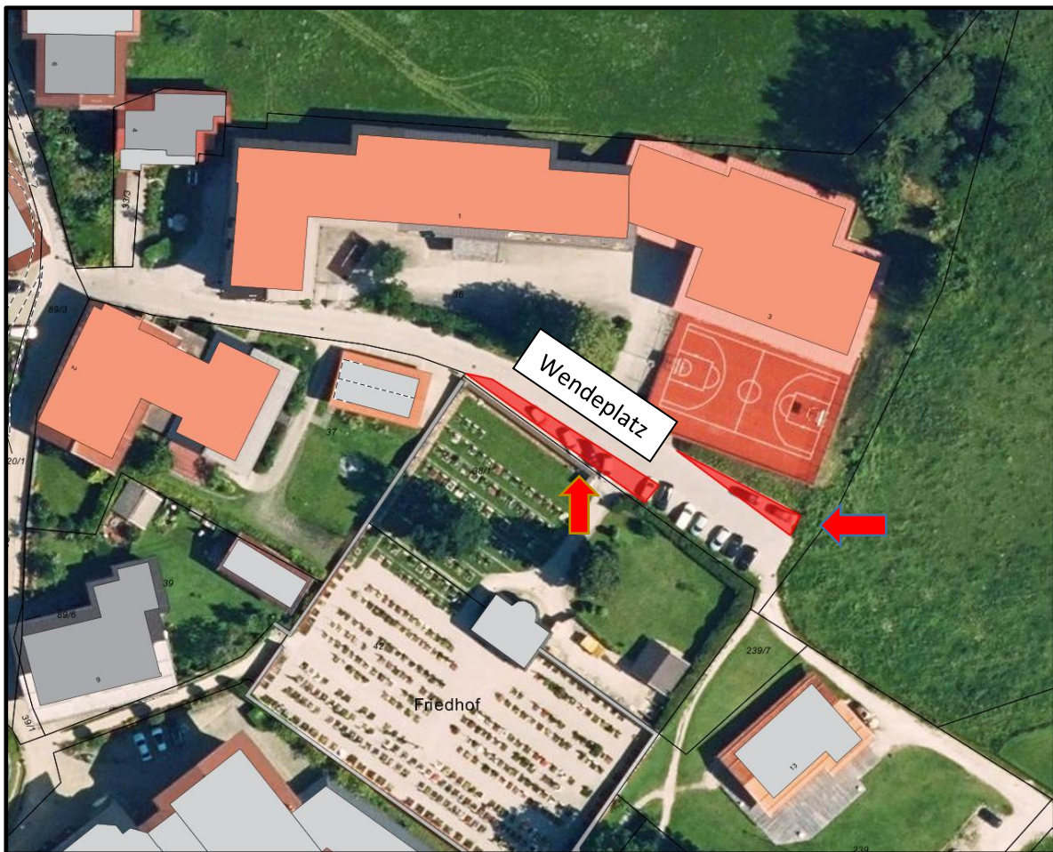
Abb.: Wendeplatz Feuerwehr am Parkplatz Turnhalle

Hierfür müssen leider einige der vorhandenen Parkplätze für die Bauzeit laut angefügtem Planausschnitt (rot markiert) gesperrt werden.