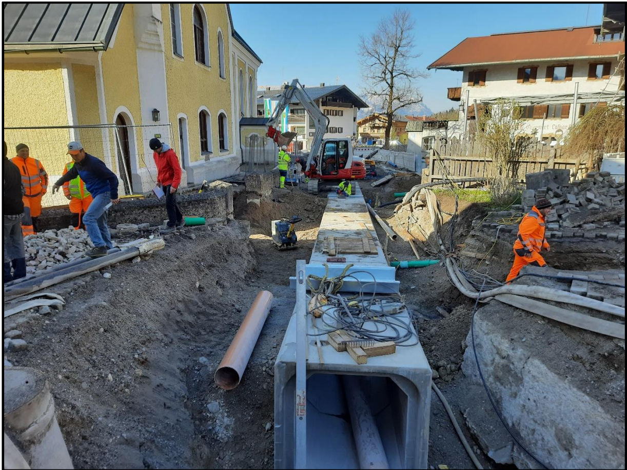
Foto: Stand der Baustelle hinter der Kirche

Wie bereits im März 2022 berichtet, errichtet der Freistaat Bayern, vertreten durch das Wasserwirtschaftsamt Traunstein, derzeit den Hochwasserschutz am Hausbach. Ziel für die Gemeinde Reit im Winkl ist es, einen Schutz vor einem einhundertjährigen Hochwasserereignis zu erreichen.