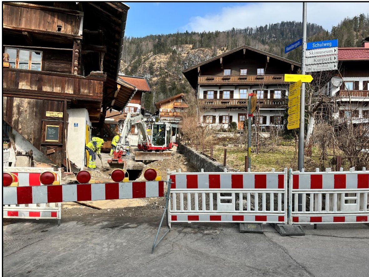
Foto: Beginn der Bauarbeiten Abschnitt obere Hausbergstraße

Den gesamten Winter über ruhten die Bauarbeiten und werden nun fortgesetzt.